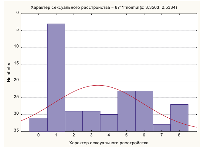
Рис. 3. Характер сексуального расстройства: 0 – сексуальное нарушение отсутствует; 1 – снижение влечения; 2 – гиперлибидемия; 3 – нарушение эрекции; 4 – задержка семяизвержения; 5 – ускоренное семяизвержение; 6 – гиполибидемия + эректильная дисфункция; 7 – гиперлибидемия + задержка семяизвержения; 8 – гиполибидемия + задержка семяизвержения

Сексуальное влечение оценивалось как субъективно (на основании жалоб пациента, анамнестических данных), так и объективно (по данным опроса партнера). При этом не всегда происходило совпадение обоих результатов. В клинической картине преобладали интерпретации пациента о снижении полового влечения на основании дезактуализации жизненных интересов. На сексуальные проявления пациентов оказывали влияние наличие физического (неврологического) дефекта, состояние партнерских отношений, а также их длительность. Нередко неврологические симптомы (парезы, речевые нарушения), психопатологическая симптоматика (в аффективной сфере) приводили к снижению интереса к половой активности и как следствие – к гиполибидемии. При обращении к квалифицированной помощи в посттравматическом периоде прерогатива принадлежала врачам-неврологам.